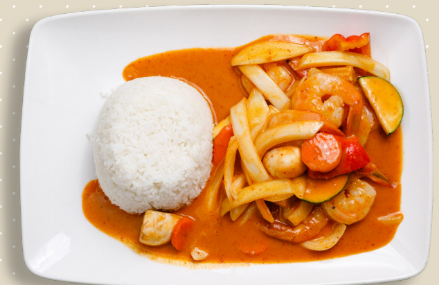
23. Tigerräkor rödcurry )))