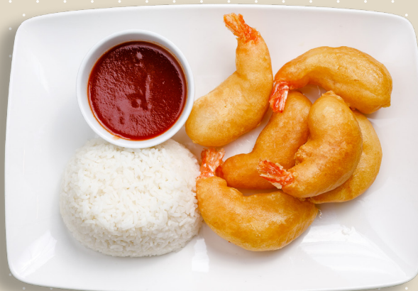
15. Friterade räkor valfri säs