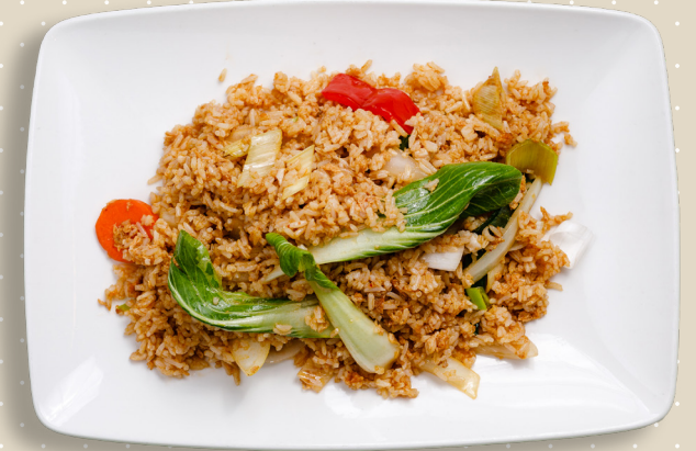
V5. Stekt ris tofu grönsaker