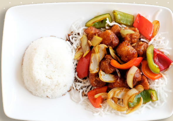
22. Lättfriterad kyckling kungpaosås torkat risstick