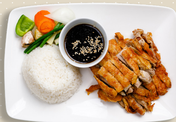
21. Krispig ankfilé grönsaker specialsäs