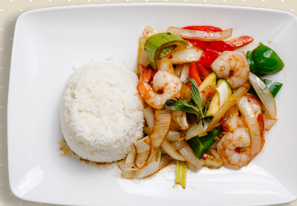
24. Tigerräkor thaibasilika )))