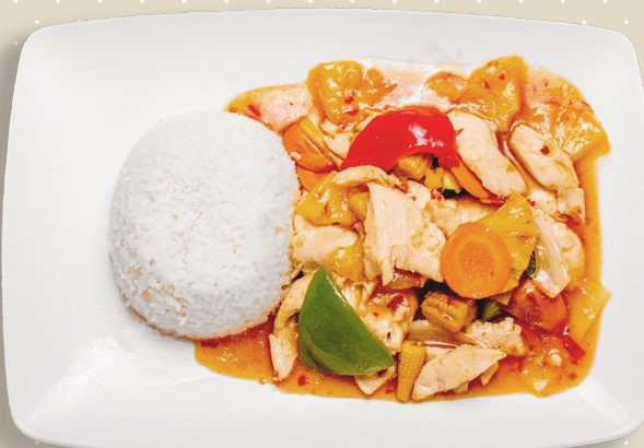
25. Tigerräkor sweetchilisäs