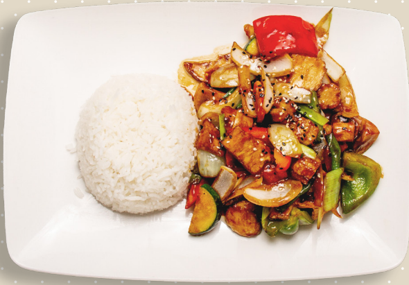
V2. Tofu grönsaker sesamsås