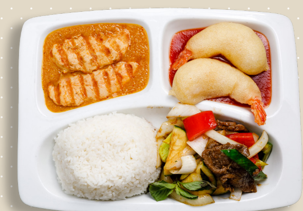
D3. Biff thaibasilika ))) Grillade kycklingspett jordnötsås Friterade räkor sötsursås