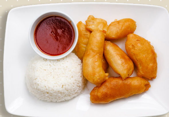
14. Friterad kyckling valfri säs