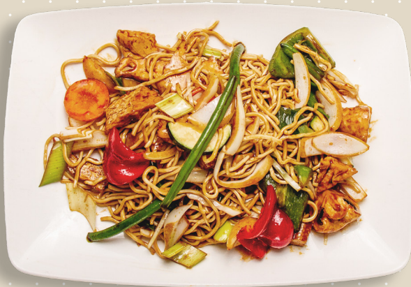
V4. Äggnudlar tofu grönsaker